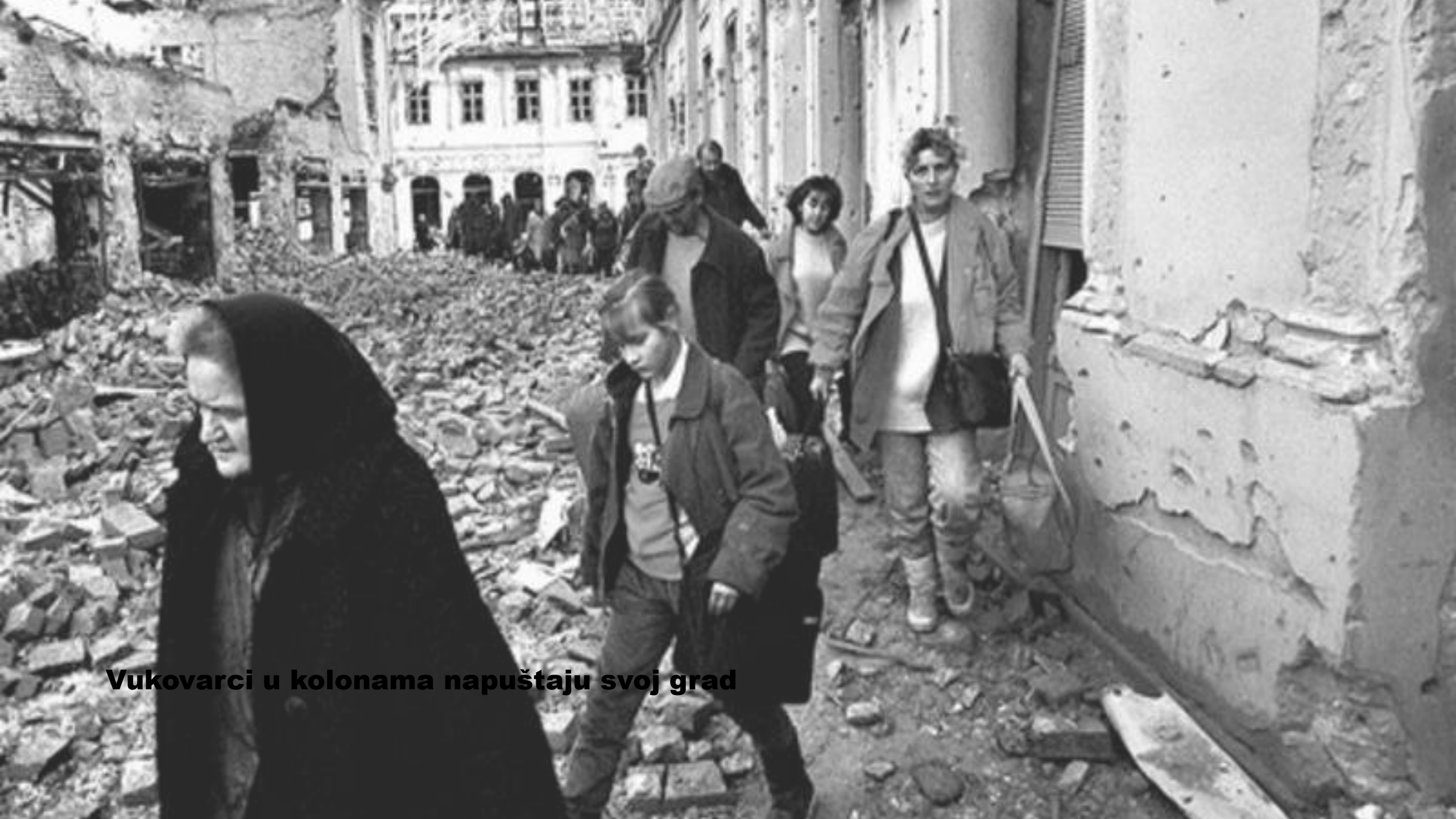
Vukovarci u kolonama napuštaju svoj grad