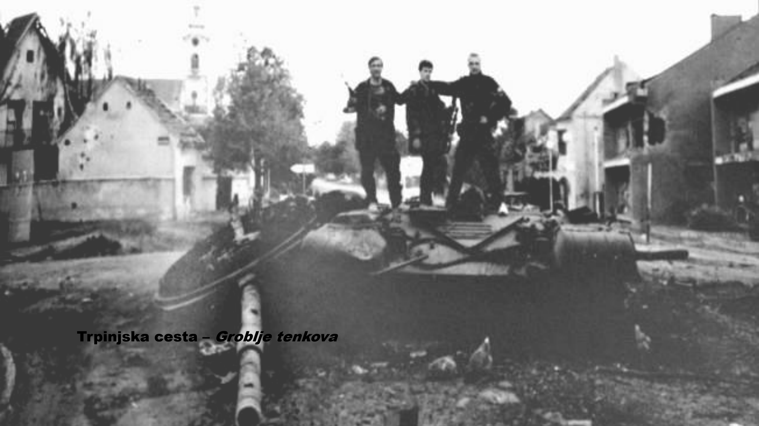
Trpinjska cesta – Groblje tenkova